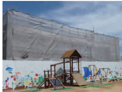
工事用の仮囲いに園児たちが楽しい絵を描きました。みんな大喜びです。