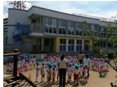
I 期工事が終わって、新しい園舎の前で運動会の練習をする園児たちと先生