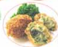
牡蠣と野菜の クリームクロケット

ネギのソテーはじつは日本魯星……と、大手メーカーにもその商品のクオリティーの高さは認められています。