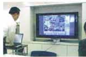
中国支社の製造工程をリアルに 伝える大画面テレビ