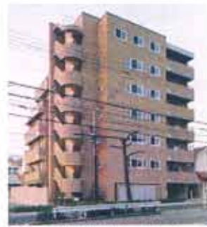
外断熱工法を採用したマンション ファスタージュ西岡本サーモス

いくらコンクリート造といえども、つねに雨や風、太陽熱にさらされている建物が、もろくなるのは当たり前です。外断熱は、断熱材によって外側から建物を保護し