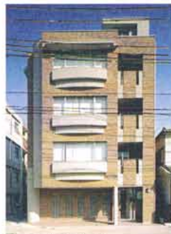
レンガ風の壁が美しいビル。