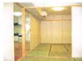
上) 和室も開放的でスッキリ

ご主人の書斎には趣味のアンティークのカメラがずらり、すっきりとした空間とのバランスが見事です。