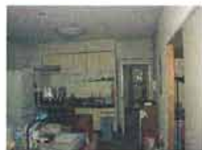
上) リフォーム前のリビング・ダイニング 右) リフォーム後、収納棚も完備

しかし、このままにしておくにも、建物自体は第25年が経っており、老朽化が見え始めています。そこで思い切ってリフォームしようと思い立ち、あれこれ構想を巡らせた。そんなN様が描いた理想のマンションとは、どのようなものだったのでしょうか？