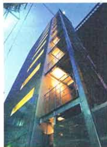
シャープなイメージのマンション。