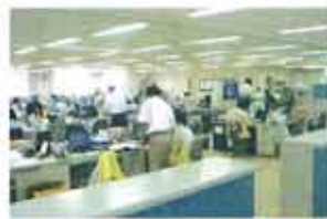
明るく開放的な事務所