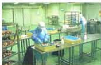
エビを手作業で加工中