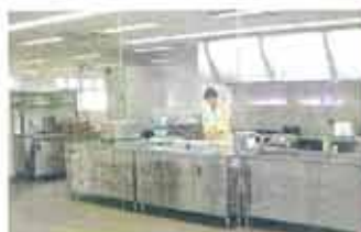
全面ガラス張りの「クリエイティブ・ラボ」