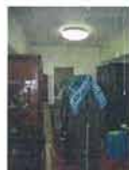
左) リフォーム前の納戸 下) リフォーム後 たっぷり収納できるウォーキング・クローゼットに