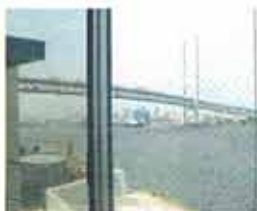
社員食堂の窓から望める深江大橋